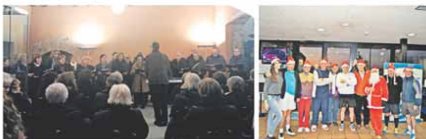
Cantada de Nadales per part de la Coral del Club; protagonistes dels Pares Noel 'matiners'